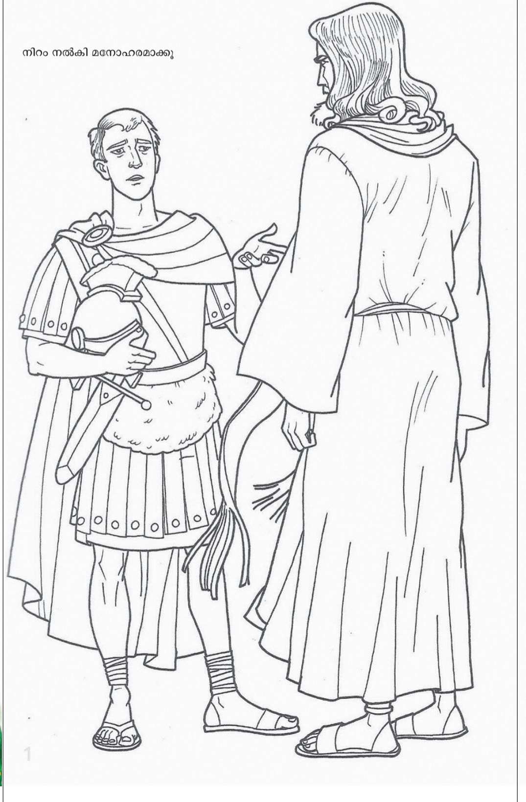
നിറം നൽകി മനോഹരമാക്കൂ

'ഇനി ഒരിക്കൽ കൂടി ആ ബൾബ് തകർന്നാലും 24 മണിക്കൂർ കൊണ്ടെങ്കിൽ പുനർനിർമ്മിക്കാം. എന്നാൽ അയാളുടെ ആത്മവിശ്വാസം നഷ്ടമായാൽ ഇരുപത്തിനാല് വർഷമെടുത്താലും ചിലപ്പോൾ തിരികെ നൽകാൻ സാധിച്ചെന്ന് വരില്ല.