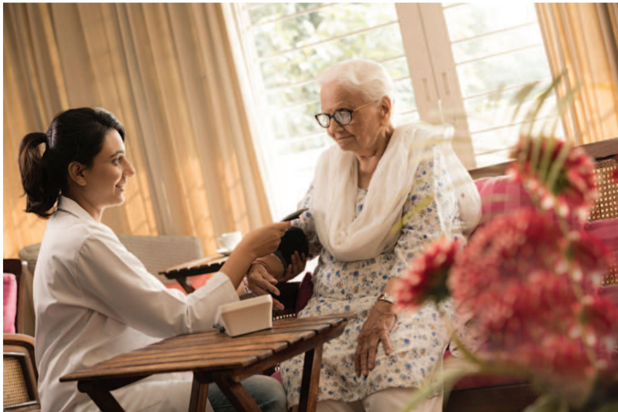
ശരീരത്തിലെ ഒട്ടുമിക്ക അവയവങ്ങളെയും ബി.പി. എന്ന വിലുപാടി ബാധിക്കുന്നു. ഇവയിൽ ഏറ്റവും പ്രധാനം ഹൃദയം, തലച്ചോറ്, കണ്ണ്, കിഡ്നി എന്നിവയാണ്. ബി.പി. കൂടുതലായും കണ്ടുവരുന്നത് 40 വയസ്സിനുശേഷമാണ്; എന്നാൽ ഇന്ന് 30 വയസ്സിനു മുക്തിലുള്ളവരിലും കണ്ടുവരുന്നു.

മെ യ് 17: ലോകം രക്താതിസമ്മർദ്ദ ദിനം അമിത രക്തസമ്മർദ്ദം/രക്താതിസമ്മർദ്ദം/ഹൈപ്പർടെൻഷൻ/സാധാരണയായി നാം പറയുന്നു ബി.പി. (ബ്ലഡ് പ്രഷർ) ഒരു നിശബ്ദ കൊലയാളിയാണ്. പലപ്പോഴും ഒരു ലക്ഷണങ്ങളും കാണിക്കാതെ നമ്മുടെ ശരീരത്തിലെ പ്രധാനപ്പെട്ട പല അവയവങ്ങളെയും തകരാറിലാക്കുമ്പോൾ മാത്രമാണ് നാം അതിനെ തിരിച്ചറിയുന്നത്. ശരീരത്തിലെ ഒട്ടുമിക്ക അവയവങ്ങളെയും ബി.പി. എന്ന വിലുപാടി ബാധിക്കുന്നു. ഇവയിൽ ഏറ്റവും പ്രധാനം ഹൃദയം, തലച്ചോറ്, കണ്ണ്, കിഡ്നി എന്നിവയാണ്. ബി.പി. കൂടുതലായും കണ്ടുവരുന്നത് 40 വയസ്സിനുശേഷമാണ്; എന്നാൽ ഇന്ന് 30 വയസ്സിനു മുക്തിലുള്ളവരിലും കണ്ടുവരുന്നു.