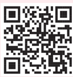
വാട്സ്ആപ്പ് ഗ്രൂപ്പിൽ ചേരാൻ ക്ലിക്ക് ചെയ്യുക. സ്കാൻ ചെയ്യുക.