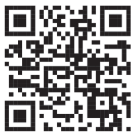
വാട്സ്ആപ്പ് ഗ്രൂപ്പിൽ ചേരാൻ ക്യാആർ കോഡ് ന്കാൻ ചെയ്യുക.