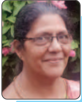
ലഗൂനി തണ്ണിപ്പാറയിൽ വിമല ബുക്ക്സ് & പബ്ലിക്കേഷൻസ് കാഞ്ഞിരപ്പള്ളി

കേരളത്തിനകത്തും പുറത്തുമായി ഇരു നൂറ്റമ്പതിലധികം കേന്ദ്രങ്ങളിൽ വിമലയുടെ പുസ്തകങ്ങൾ ലഭ്യമാണ്. വിവിധ കേന്ദ്രങ്ങളിലും ധ്യാനകേന്ദ്രങ്ങളിലും മറ്റു പുസ്തക പ്രസാധകരുടെ സ്റ്റാളുകളിലും വിമല പുസ്തകങ്ങൾ വിതരണം ചെയ്യുന്നു.