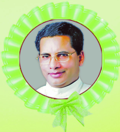
മാർ ജോസഫ് കല്ലറങ്ങാട്ട്