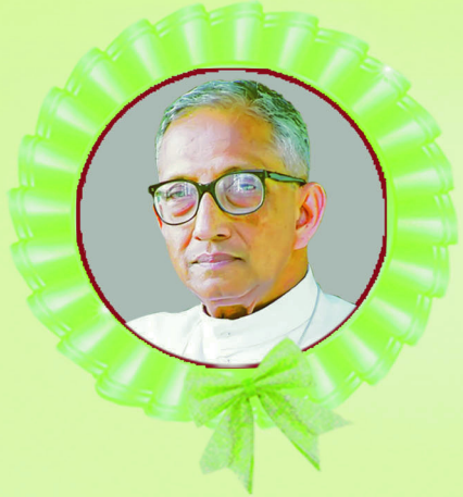
മാർ ജോസഫ് പൗറ്റത്തിൽ