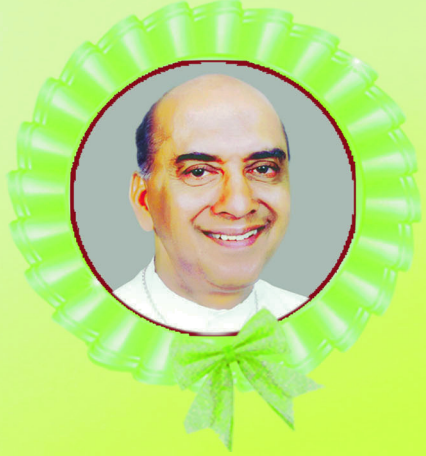
മാർ ജോസഫ് പള്ളിക്കുഴപ്പിയിൽ