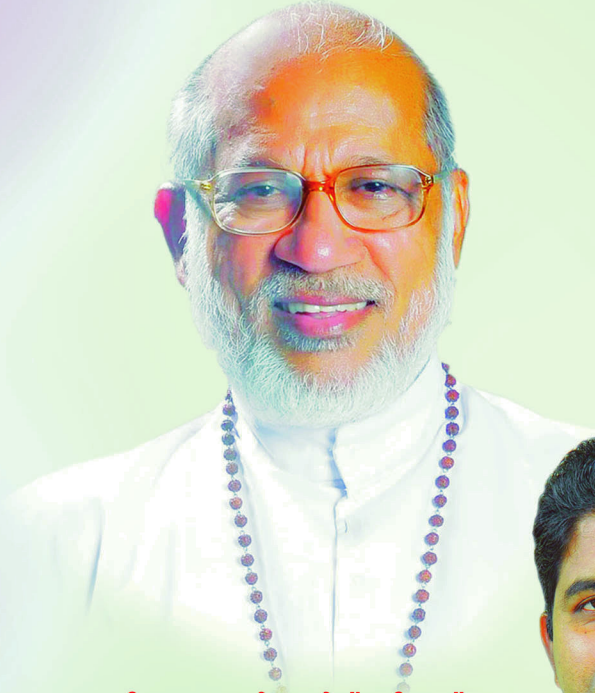
അഭിവന്ദ്യ മേജർ ആർച്ച് ബിഷപ്പ് കാർഡിനൽ മാർ ജോർജ് ആലഞ്ചേരി പിതാവിനും